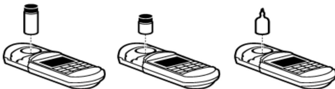
图 5 将样品放入样品池盒中

用不起毛的布或纸巾擦拭样品池, 然后将样品池插入样品池盒中, 并使菱形标记朝着键盘。