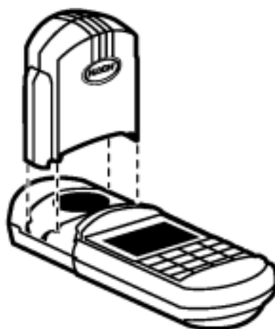
图 8 安装遮光器

为了在测试实验时使用仪器罩作为遮光器,应将仪器罩放在样品池上,并插入仪器上的凹槽。