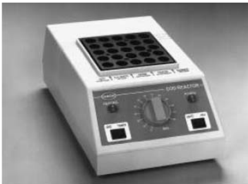
图 1 45600 型 COD 反应器

任选的防护物是一块涂覆着 15 英寸高、3/16 英寸厚的聚碳酸脂的钢板。它放置于 COD 反应器或 THM 反应器前面的实验台上,以避免操作者受到破裂的试剂瓶(一般不会发生)中溅出试剂的伤害。